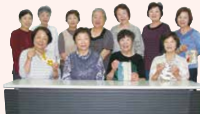
▶作り方◀熊取町長生連女性部