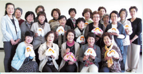
▶作り方◀和泉市老連女性部会