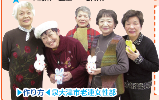
▶作り方◀ 泉大津市老連女性部