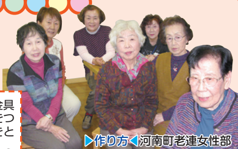
▶作り方◀ 河南町老連女性部

③ 仕上げ 裏布を中に入れて形を整え、金具の幅に合わせて通し口を縫う。金具を通し口に通して完成。