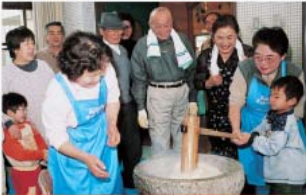
ベッタン、ベッタン、楽しいなあ。 堺市美原町老連の会員が子どもたちに伝承している新春恒例の もちつき大会(同市美原町「みはら北児童館」)

このような厳しい状況の 中、私たち高齢者が互いに力 を合わせ、自らの健康長寿や 生きがいづくり、次世代支援 など社会貢献に積極的に取り 組んでいく必要があります。 当連合会として、ますます、 魅力あるクラブ活動の推進に 努め、一人でも多くの高齢者 に老人クラブに加入してい ただけるよう頑張ってい ます。皆様 方のご支援、 ご協力をお願 い申し上げます。