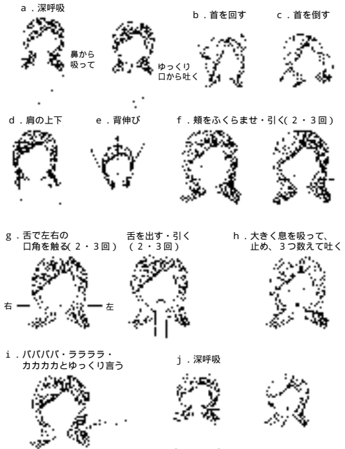
イラストは、聖隷三方原病院 嚥下チーム：嚥下障害がкетマニュアル第2版 医歯薬出版 2003, P67 より

「誤嚥」は食べ始めの一口目によく起こります。運 動の前に準備体操をするように、食事の前に「嚥下体 操」をすることにより、食べるために使う口や舌、ほ お、のどの動きがよくなり、「誤嚥」を防ぐことができ ます。【嚥下体操の一例】嚥下体操の方法はいろいろあ ります。飲み込む機能に合わせて実施する必要があります ので、自己流で実施するのではなく、必ずかかり つけのお医者さん、歯医者さんの指導を受けて実践し て下さい。