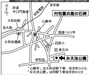
「心願寺」は大和田駅下車、徒歩約30分。 「弁天池公園」は同駅下車徒歩約60分

進し、岸和田地区に弁天池公園があります。水と緑が豊かなこの公園には、サクラなど四季折々の彩りを見せる樹木も多く、つり橋のあるわんぱくランドや芝生公園などが市民の憩いの場になっています。池には、たくさん