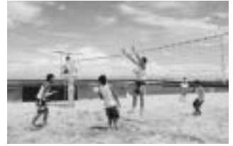
箱作海水浴場で開かれる全日本ビーチバレージュニア男子選手権