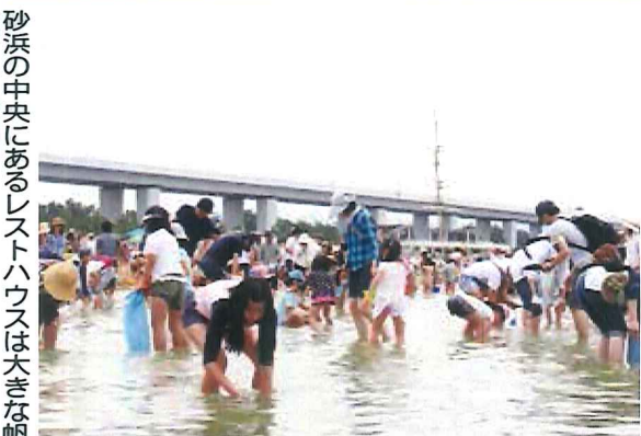
砂浜の中央にあるレストハウスは大きな帆船マストが目印