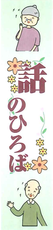
年齢、日付等は投稿時のものです