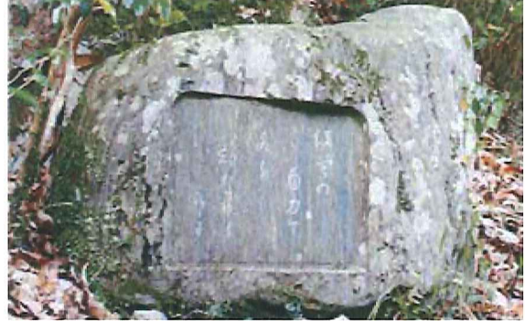
「流蜚の自力で水を離れ飛ぶ」と記された山口誓子の句碑

約3000本の桜が咲き誇る中で花見、夏は涼しい河原での水遊びやホタル観賞、秋は朱に彩られたモミジ谷やクヌギ谷での紅葉狩りと、四季折々の風情を味わうことができます。