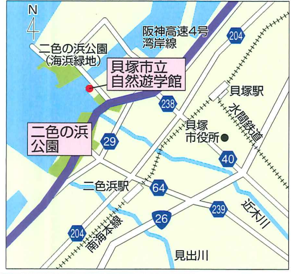
二色の浜公園(海浜緑地) 貝塚市立自然遊学館 二色の浜公園 二色浜駅 見出川