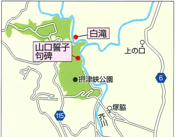
【白滝】JR東海道本線「高槻駅」下車、高槻市営バス上の口行き、原大橋行き「上の口」バス停から徒歩20分

に美しい景色を愛でるだけでなく、自然に触れて、遊べて、学べる尽きることはない自然に溢れています。