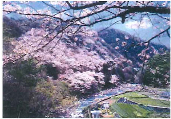
江戸時代から親しまれる摂津峡は春の桜をはじめ四季折々の姿を見せる