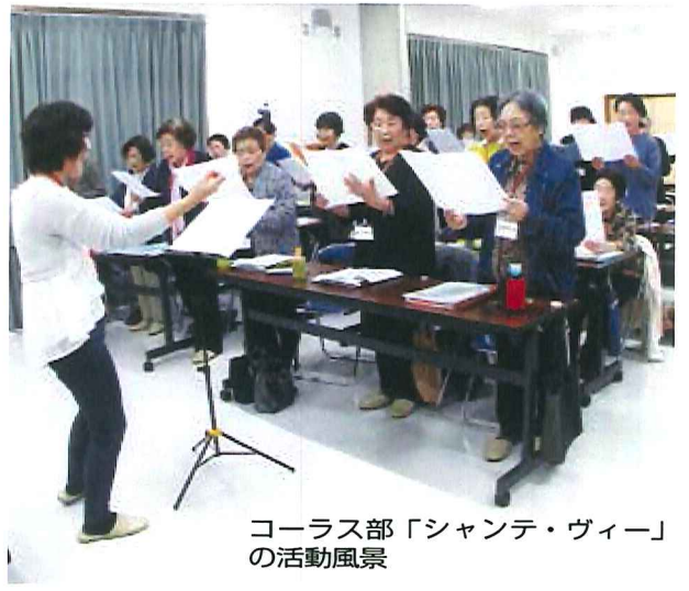
コーラス部「シャンテ・ヴィー」の活動風景